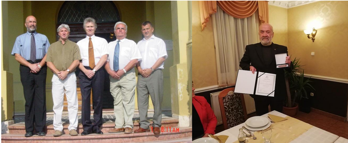
A VOSZ megyei elnöksége, 1999,

Szabolcs-Szatmár-Bereg megyei Szervezete